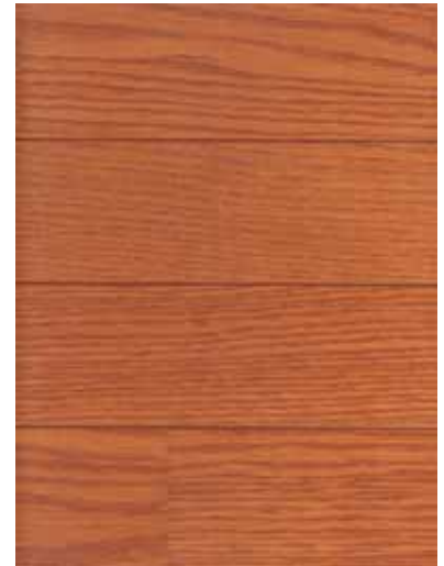
KD-10C キャラメルオーク